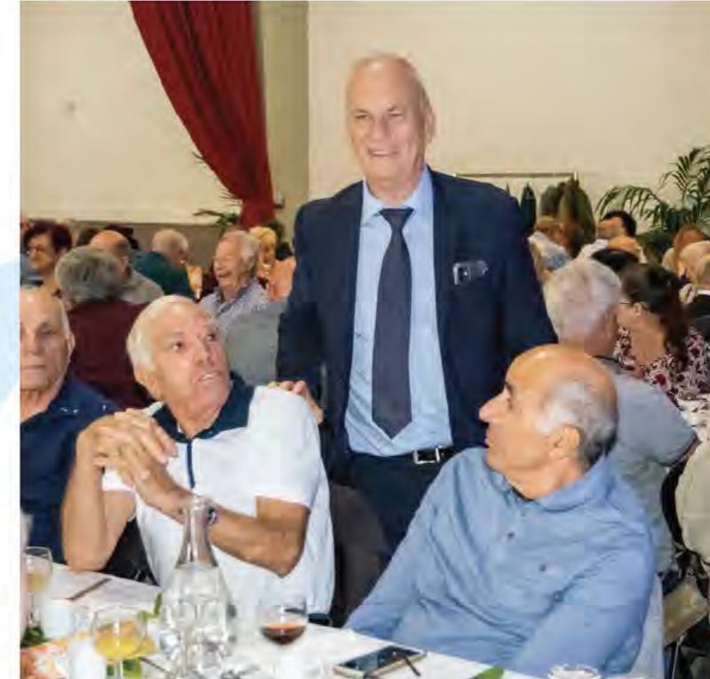
Le Maire avec les Berrois.