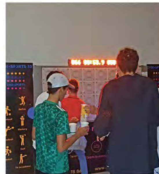
Un mur digital donnait l'occasion de tester ses réflexes après avoir virtuellement « consommé » du cannabis ou de l'alcool, exercice peu évident.