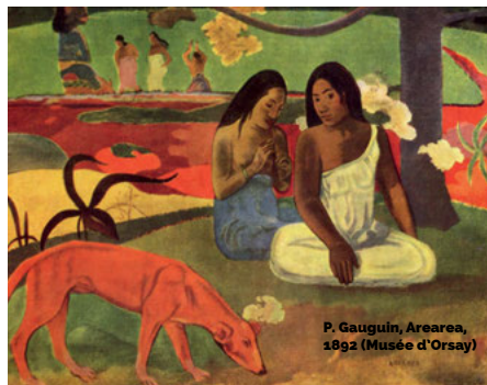
P. Gauguin, Arearea, 1892 (Musée d'Orsay)

Retrouvez l'équipe de la médiathèque et leurs Mots-Garous au cœur du carnaval organisé par le Forum des jeunes et de la culture.