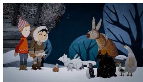
Neige d'Antoine Lanciaux et Sophie Roze

Projection en salle du film Neige et les arbres magiques , programmé pour Maternelle au cinéma , (durée de 50 minutes), suivi d'un échange animé par Juliette (durée 30 minutes).