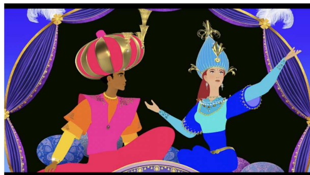
Le Pharaon, le sauvage et la princesse de M. Ocelot

Programmation établie par le cinéma et proposition de dates par rapport au calendrier de la salle.