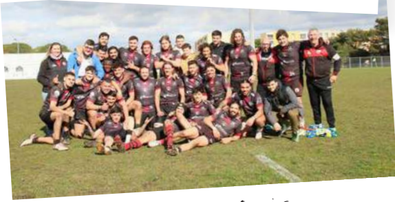
COB : Réserve Espoirs