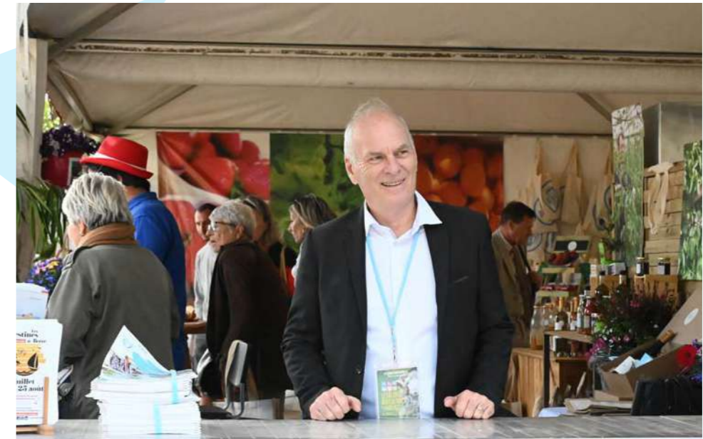
Le maire au Salon des agricultures de Provence