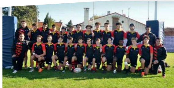
COB : Cadets