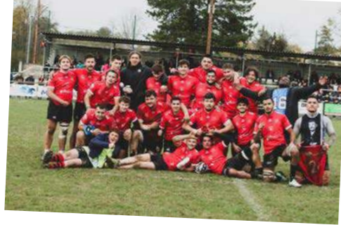
COB : Fédérale 1